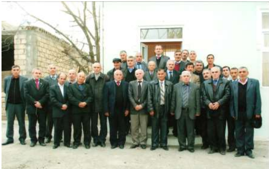
Таһир Салех “Күлүстан”(Губа), “Шабран” (Шабран) вә “Улдузлар”(Хачмаз) әдәби мәчлисләринин үзвләри арасында