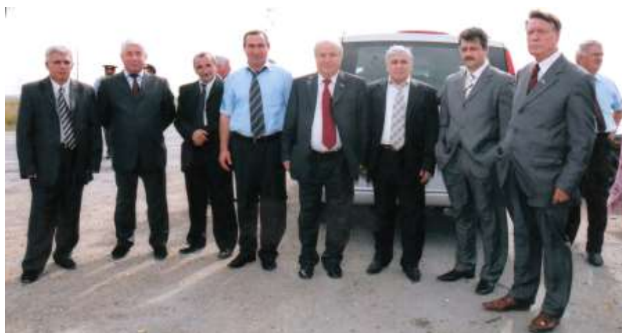
Таһир Салех Дәрбәнд рајонунун көркәмли дөвләт, сijaсичтимаи хадимләри вә башгалары арасында