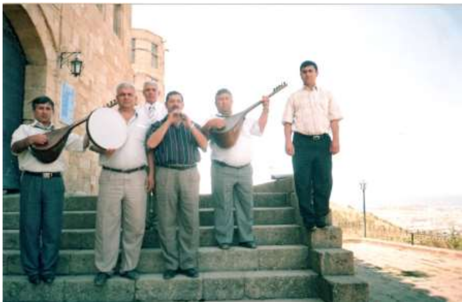
Дәрбәндин “Күлүстан” ашыглар ансамблы Нарынгалада