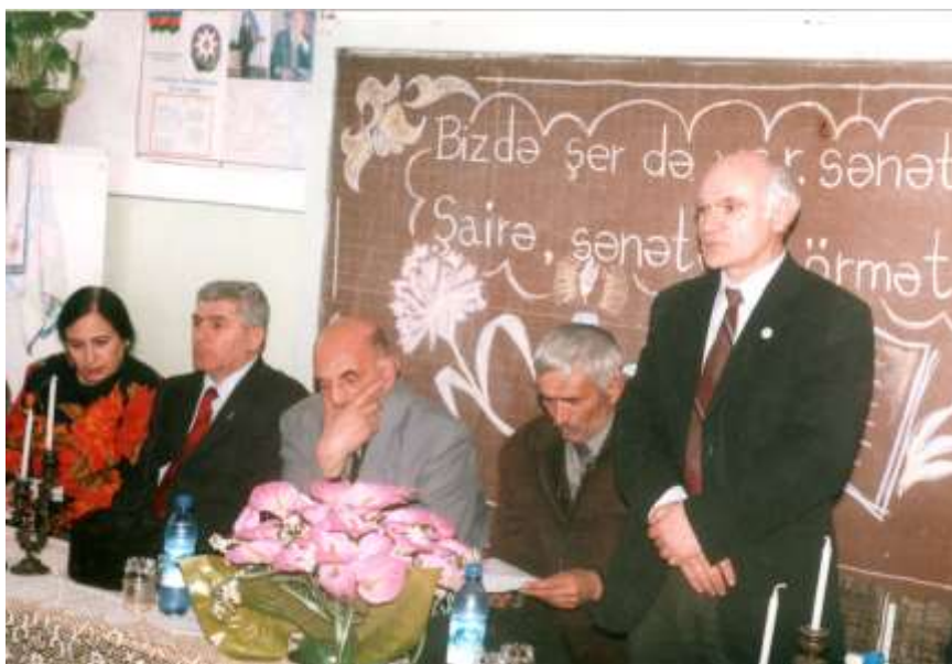
Тәһир Салех Губа елми-әдәби мәчлисинин мәшғәләләриндә мүтәмади олараг иштирак едир