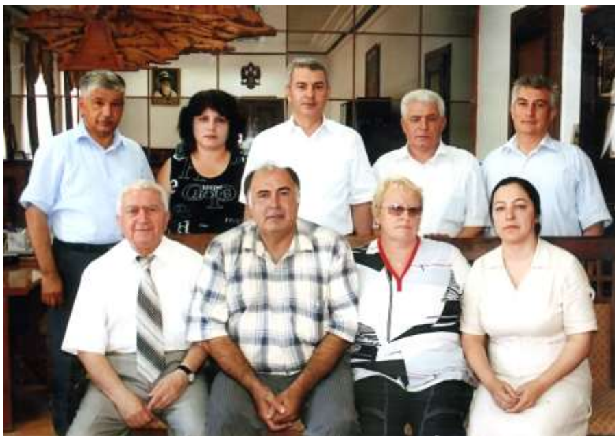
Дәрбәнд Бејнәлхалг “Күлүстан” Әдәбијјатчылар Иттифагынын үзвләри Дәрбәнд шәһәр меринин гәбулунда