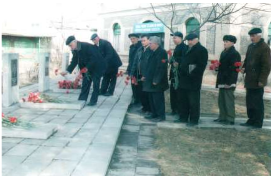
Жүлүстанчылар Губанын Шәһидләр хијабанында