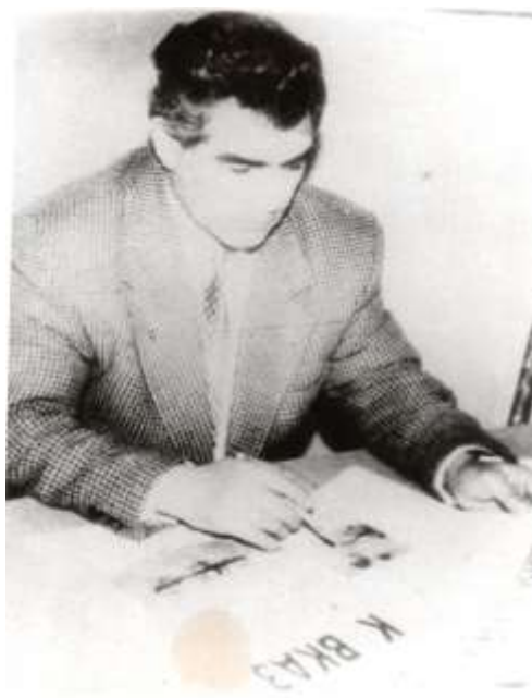
О, һәм дә бурада “Гафгаз” журналынын Дағыстан редаксијасынын рәһбәридир