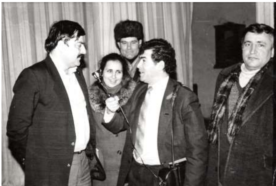
Таһир Салехә мәшһур космонавт Муса Манаровла да мусаһибә көтүрмәк гисмәт олуб