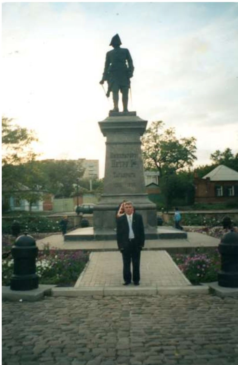
Таһир Салех Бөжүк Пјоторун абидәси өнүндә (Таганрог).