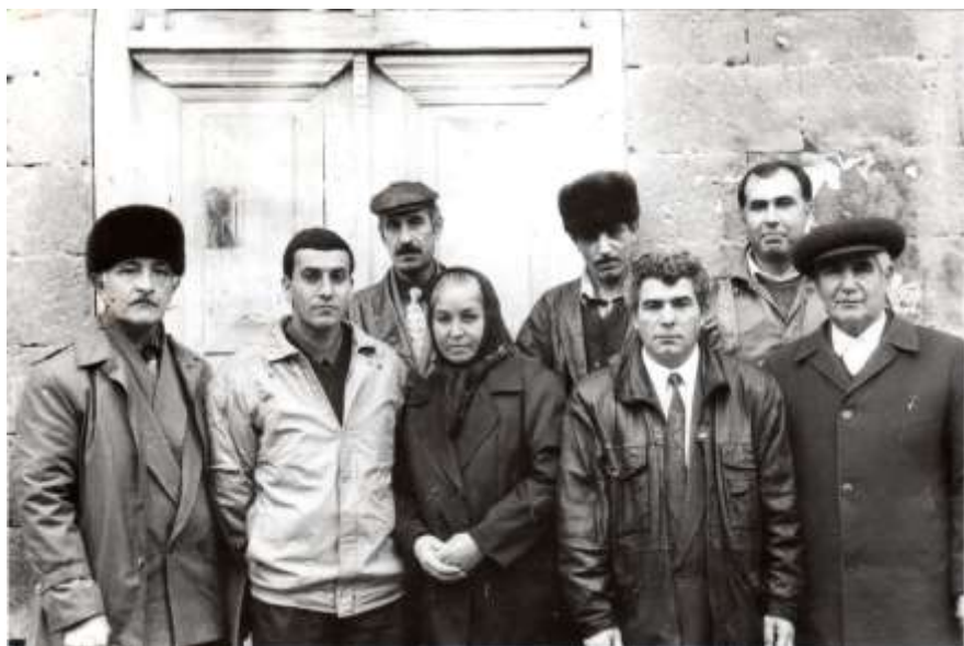
Дәрбәнд “Күлүстан” Әдәби Бирлијинин илк үзвләри һәм дә ејни адлы – “Күлүстан” гәзетинин фәал охучуларыдырлар